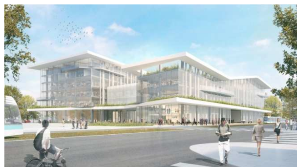
Projet du Grand Équipement Documentaire qui rassemblera plus de 1 million de volumes

C'est ce grand projet que nous pourrons découvrir le vendredi 18 novembre 2016