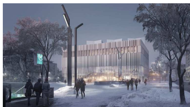
Projet du Centre des colloques en façade sur la place du Front Populaire