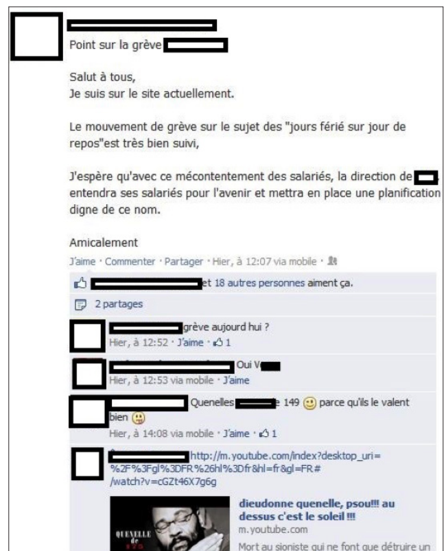
Ci-dessus la capture d'écran de la page d'un délégué CGT

Il est donc important d'avoir une réaction (message privé, discussion dans le syndicat...), et suppression s'il s'agit d'un commentaire ou média d'une organisation CGT. Plus il y aura de camarades qui réagissent, plus nous montrerons que le refus des idées d'extrême-droite est fort !