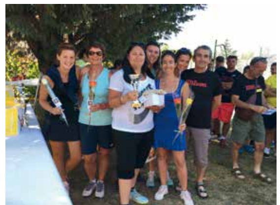
L'équipe de l'ASUL