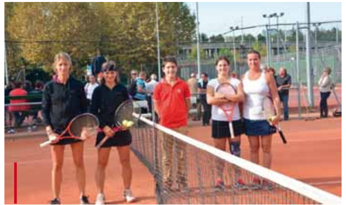
Le double sera décisif pour l'attribution du titre de Première division féminine, remporté par l'USFEN 40, 13/11 dans le super Tie-Break.

Outre l'aspect sportif, l'aspect festif et la convivialité étaient les autres priorités de cette cinquantième édition puisque réceptions et visites de Lyon étaient au menu des participants. Après un cocktail de bienvenue offert par la municipalité de Villeurbanne à la mairie, un repas d'accueil des équipes et dirigeants a réuni 160 convives au restaurant « Tout le monde à table » à Vaise, le vendredi soir. Après la journée de compétition une grande soirée de gala, réunissant 230 joueurs, dirigeants et partenaires au