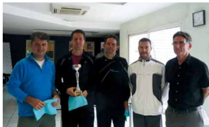
Les équipes messieurs BNP (10402222 – à gauche) vainqueur en D1 messieurs et VIT'APRIL (220 – à droite) vainqueurs en D2 messieurs.