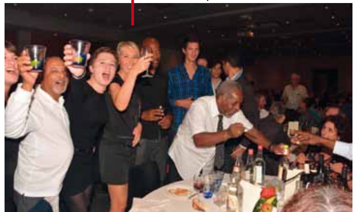
La fête bat son plein auprès de la table des représentants des DOM-TOM.

château de Sans Soucis à Limonest, a été l'occasion d'une remise de prix aux vainqueurs et finalistes.