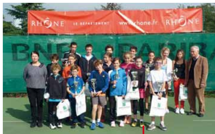
Les équipes 15/16 ans