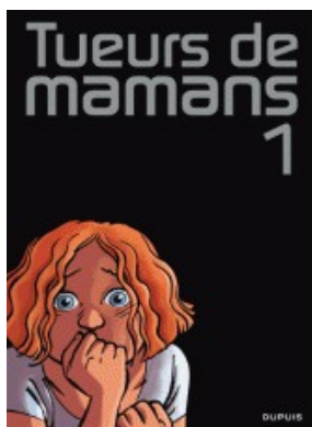
Tueurs de mamans / Zidrou, Benoît Ers & Ludowick Borecki. (Tueurs de mamans ; 1)