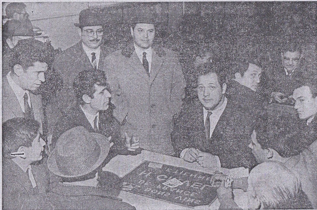
On joue aux cartes