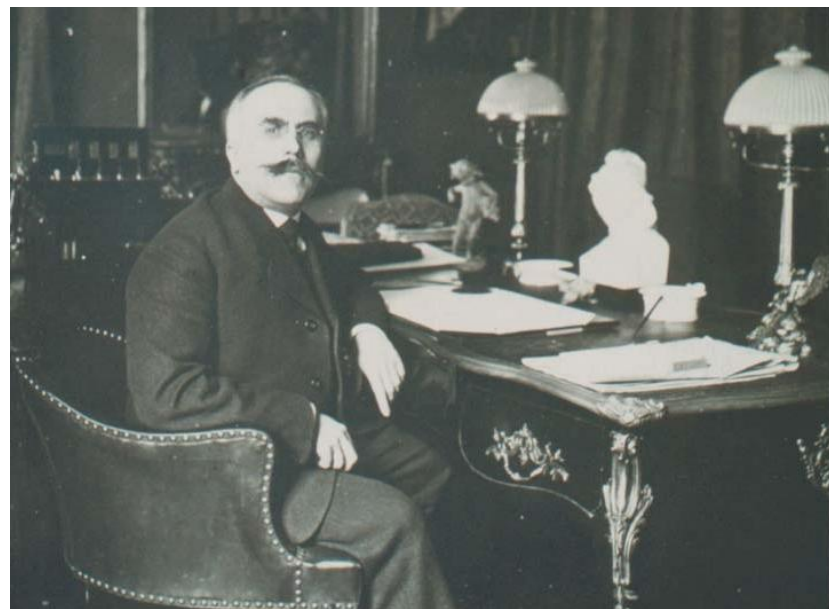
Justin Godart, ancien Ministre et Maire de Lyon

constituant les forces militantes de l'association