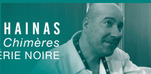
ANTOINE CHAINAS Empire des Chimères SÉRIE NOIRE