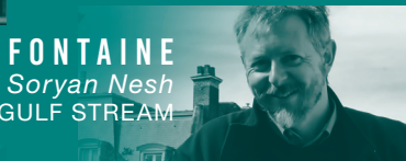
MAXIME FONTAINE Les 100 visages de Soryan Nesh GULF STREAM