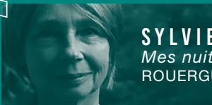
SYLVIE DESHORS Mes nuits à la caravane ROUERGUE DOADO