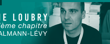
JÉRÔME LOUBRY Le douzième chapitre CALMANN-LÉVY