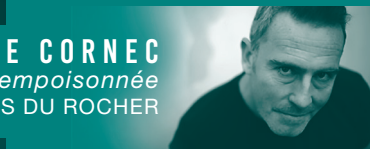
GUILLAUME LE CORNEC La Presqu'île empoisonnée ÉDITIONS DU ROCHER