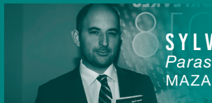
SYLVAIN FORGE Parasite MAZARINE / FAYARD