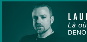
LAURENT GUILLAUME Là où vivent les loups DENOËL