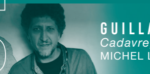
GUILLAUME CHÉREL Cadavre, vautours et poulet au citron MICHEL LAFON