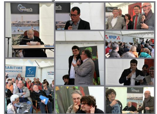
Inauguration samedi 14 mai

Au total près de 5000 visiteurs auront arpenté cette commune de Penmarc'h dont le cadre exceptionnel coupe le souffle aux nouveaux venus et donne aux habitués l'envie de revenir.