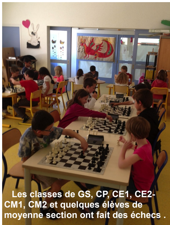
Les classes de GS, CP, CE1, CE2- CM1, CM2 et quelques élèves de moyenne section ont fait des échecs .

Le 27 juin, les classes de GS,CP,CE1,CE2- CM1,CM2 vont aller au Maxi tournoi à Juraparc où il y aura plus de 500 joueurs d'échecs.