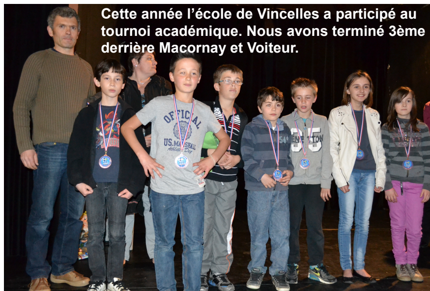
Cette année l'école de Vincelles a participé au tournoi académique. Nous avons terminé 3ème derrière Macornay et Voiteur.