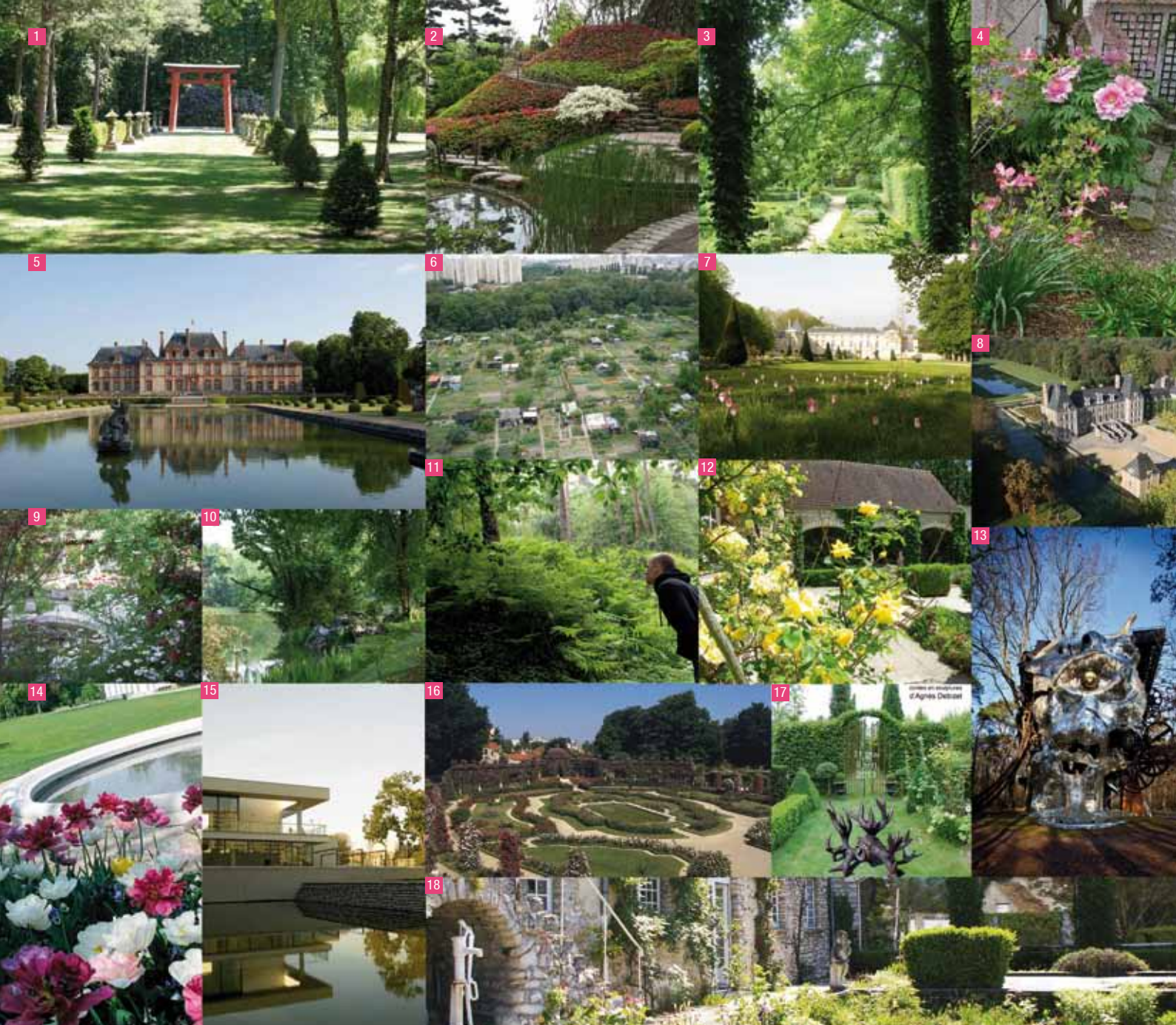
1) Ancourt Jardin japonais allée du Torii au printemps 2) Jardin Albert Kahn, Boulogne-BP 3) Jardin MAURICE DENIS - Saint germain en laye 4) Jardin Rose Pivoine 5) Château de Breteuil 6) Aubervilliers -Jardins ouvriers - vue générale 7) Le jardin de Malraison au printemps 8) Courances ancien - Parc et Château de Courances 9) Jardin VIII 10) Jardins de Courson.