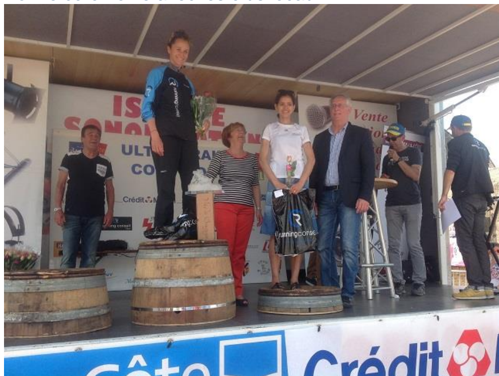
Podiums des féminines