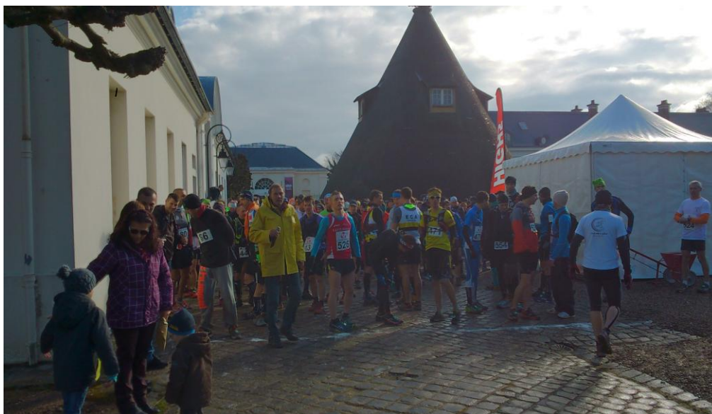
Quelques secondes avant le départ

Le départ est donné à 10 heures précises après accord du juge arbitre, du chrono électronique et des chronométreurs manuels. La ligne de départ est tracée au sol.