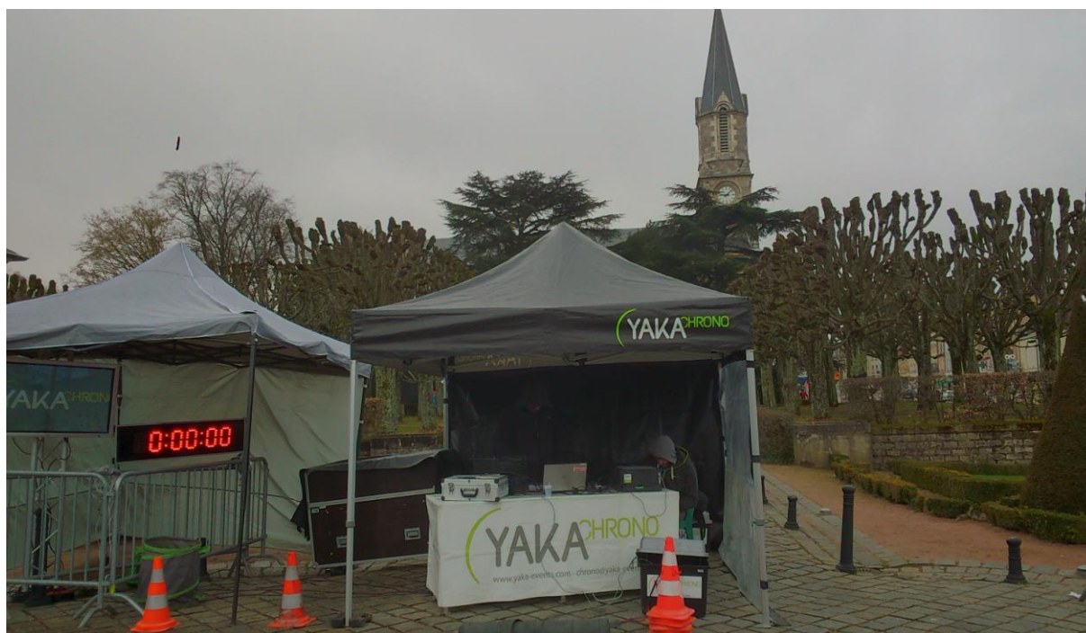
Poste de chronométrage

Le chronométrage est assuré par la société YAKA Chrono installée sur la ligne d'arrivée, et 2 chronométreurs officiels manuels. Les puces électroniques sont attachées sur les chaussures des coureurs.