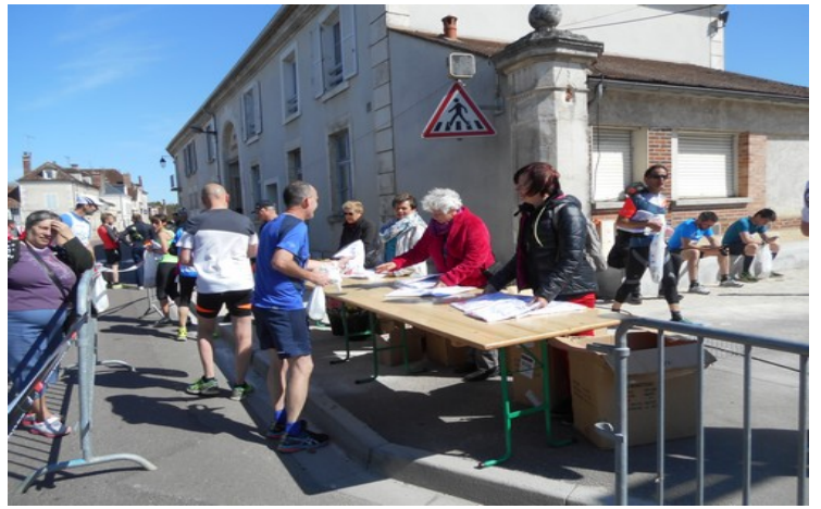
Des bénévoles au service des coureurs