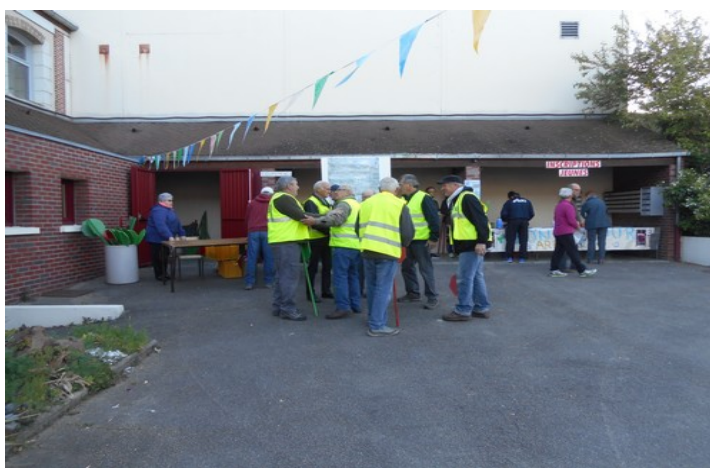
Les signaleurs récupèrent leur matériel