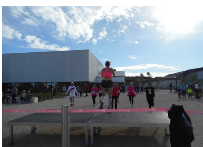
Echauffement avant le départ