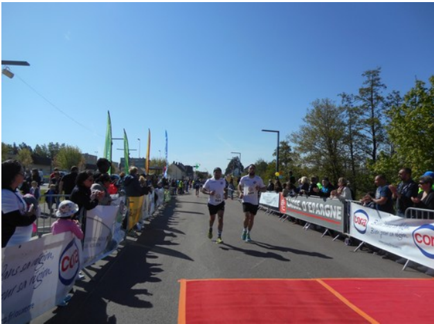
Des concurrents heureux de passer sur le tapis d'arrivée