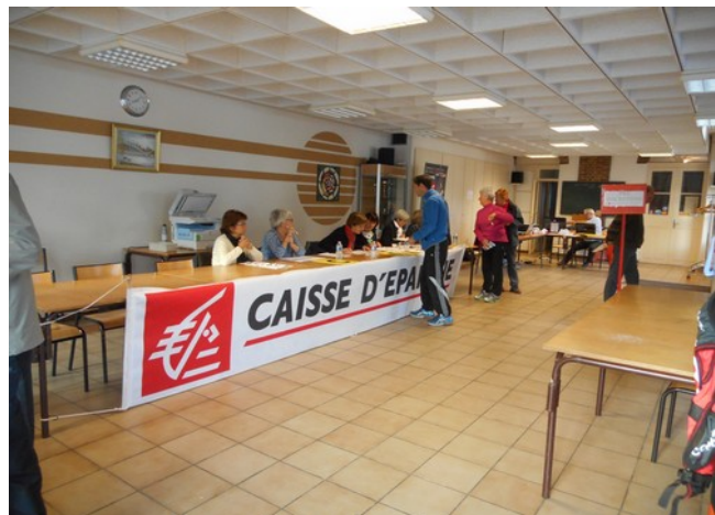
Salle des inscriptions et de saisie Informatique.