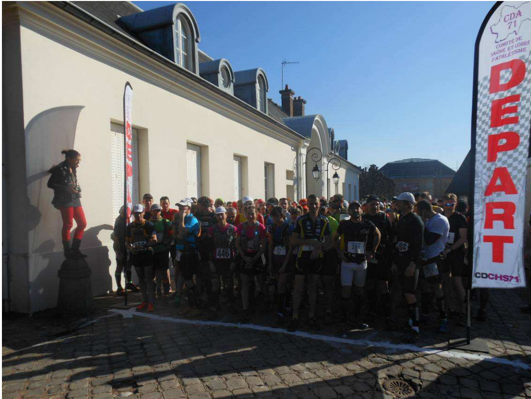
Le départ conjoint du 35 km et du 21,5 km le dimanche matin