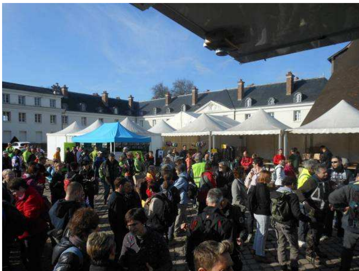
Le village course au Château de la Verrerie

Au final, j'ai découvert une très belle organisation pour laquelle le label FFA est mérité pour cette épreuve combinée atypique.