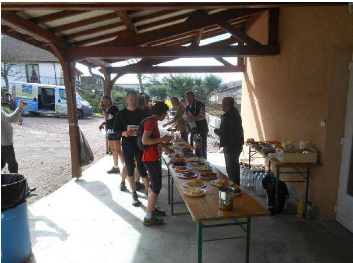
Les ravitaillements sont bien fournis et bien tenus