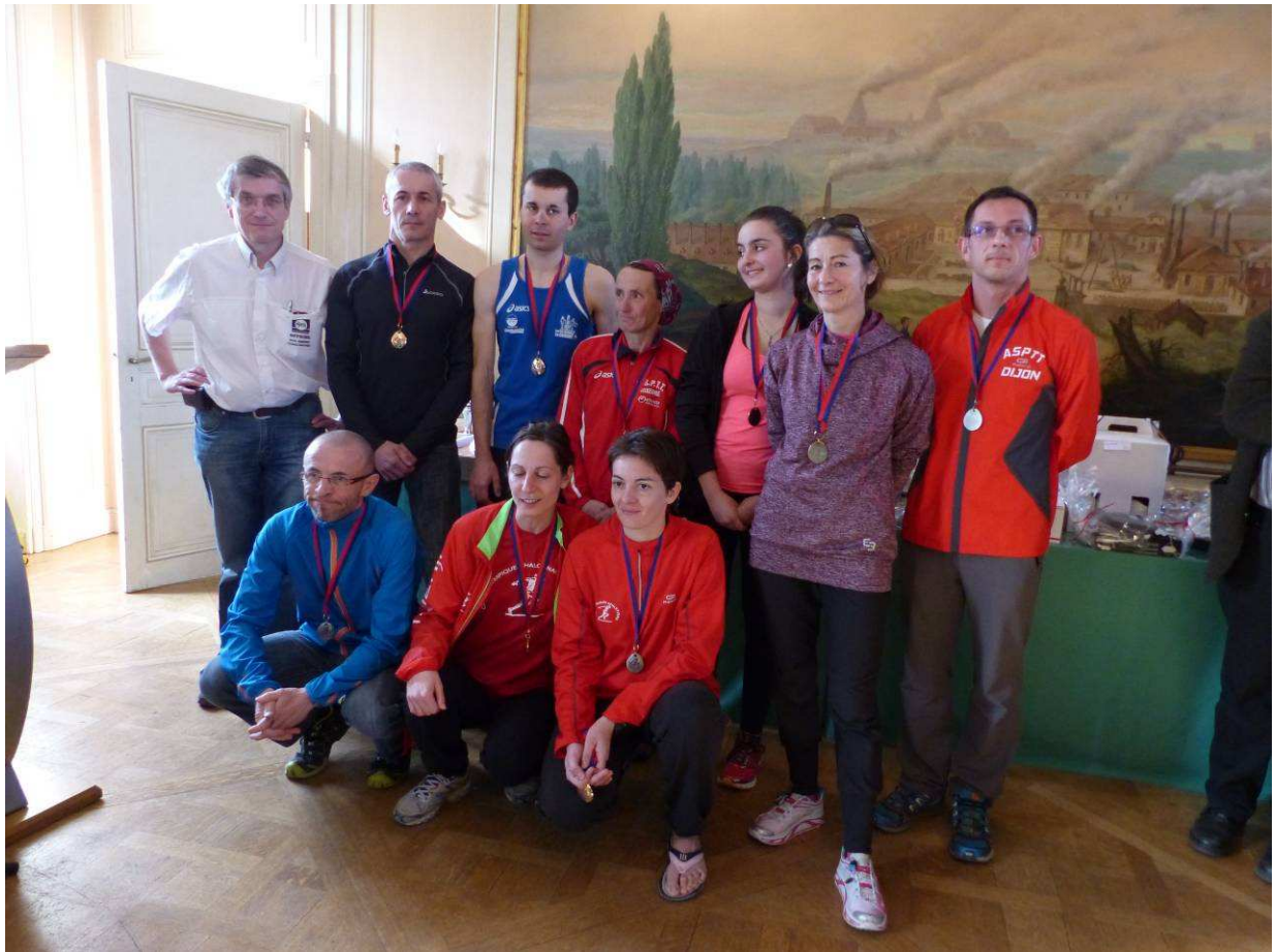
Le Podium des championnats de Bourgogne de Trail court