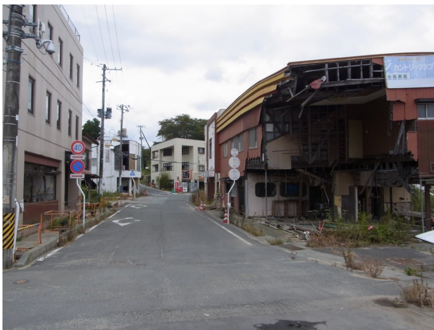
Senhoma strato antaŭ la stacidomo Tomioka en Naraha (oktobro 2015)

Iu revenintoj jene plendas: “Antaŭ la katastrofo mi povis vivi per mia malmulta pensio, ĉar mi mem kulturis kampon kaj produktis rizon kaj legomojn, sed pro la radioaktiveco mi ne plu povas rikolti ilin kaj devas aĉeti ĉion. Sen subvencio mi ne povas vivi”. En tiuj urboj multaj domoj jam estas putrintaj kaj neloĝeblaj. Mankas hospitaloj kaj vendejoj, kaj plej grave mankas najbaroj. En tiaj kondiĉoj multaj ne povas reveni. Eĉ se ili povas, la vivo tie tute ne estas kontentiga.