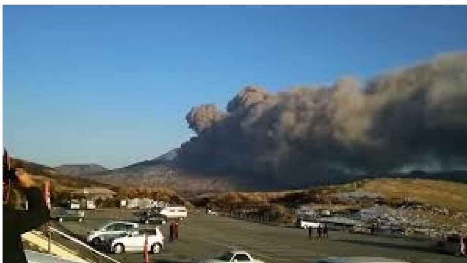
Erupcio de la monto Aso la 14an de septembro 2015

La registaro kaj la elektraj kompanioj, profitante la refunkciigon de la reaktoro de Sendai, deziras pli rapidigi la refunkciadon de aliaj reaktoroj. Nun pli ol 60 % de la popolanoj kontraŭas tiun politikon de la registaro, do okazas manifestacioj en diversaj lokoj.