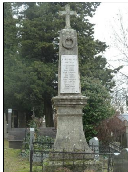
Monument aux Nières

Population civile : ravitaillement, courrier postal, fonctionnement des services publics. Accueil des blessés convalescents, des réfugiés. Prisonniers allemands.