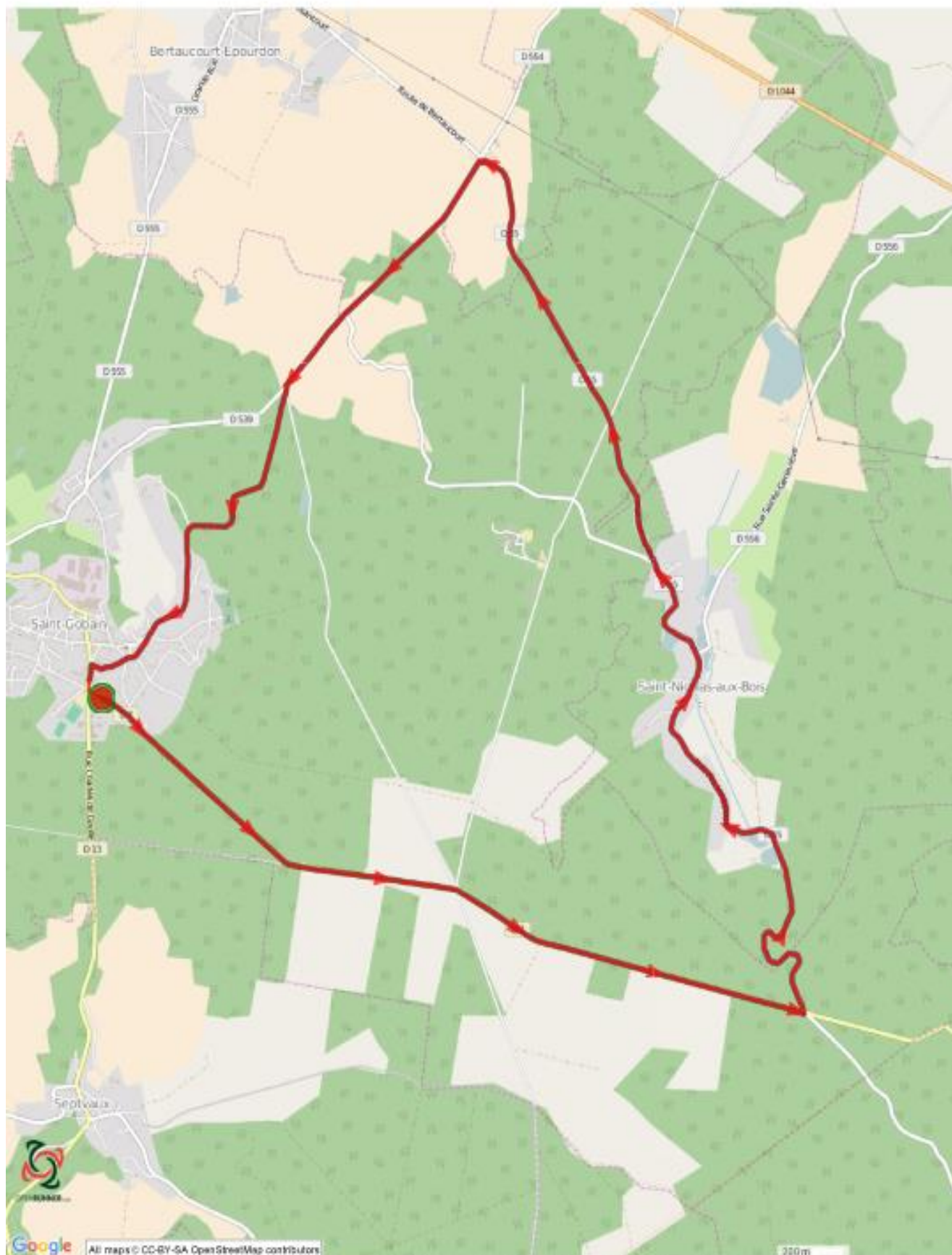
Parcours n°6995131 - championnat 02 st gobain - Cyclisme Routes, 16.07 (km) : Saint-Gobain -> Saint-Gobain