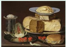
peinture à l'huile, Clara Peters, vers 1600, county museum, Los Angeles

Voyage dans l'art protohistorique avec des stèles antropomorphes, dites statues-menhirs ou des gravures d'époque néolithique et de l'âge du bronze, dont la vocation est toujours un sujet de recherches pour les archéologues.