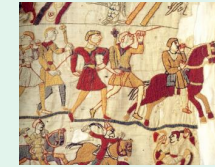
Tapisserie de Bayeux, lin et soie, XI siècle

A l'époque de l'art nouveau, les artistes puisent dans de nouvelles sources d'inspiration venues d'Asie et d'Orient : c'est aussi une redécouverte du monde végétal et de ses lignes souples, qui vont transformer le répertoire classique et faire apparaître de nouvelles façons de représenter et de créer.