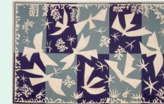
« Polynésie », 1946, par Henri Matisse, musée de Troyes

Immersion dans l'univers de l'art textile : la tapisserie avec l'analyse de diverses tentures du Moyen Âge jusqu'à la Renaissance. Nous décodons les thèmes représentés à l'époque qui ornent les murs des châteaux.