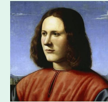
Portrait d'homme, par Piero di Cosimo, vers 1500, Londres, galerie Dulwich

Chef de file du mouvement « Fauve », Matisse explore différentes techniques picturales avant de vouer son art à la couleur pure. Cet artiste prolifique produira également de nombreuses sculptures qui traduisent sa démarche de simplification pour donner une force nouvelle aux volumes.