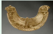
Collier phénicien en or, vers - 1700

Rassemblant des objets ou des matériaux, aliments, vaisselle, fleurs ou fruits, la nature morte est un genre pictural qui offre un rendu fidèle des matières et textures, et réveille nos sens, en abordant des thématiques parfois plus symboliques.