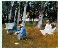
John Sargent « Claude Monet painting by the edge of wood » huile sur toile, 1885, Tate Gallery

Les parures antiques de plusieurs civilisations de l'antiquité : matières précieuses, objets symboliques et de prestige, portés par les souverains et les membres de l'aristocratie, parfois supports de croyances et de vertus magiques, les bijoux remplissent aussi des rôles de protection, de guérison ou d'accompagnement vers l'au-delà.