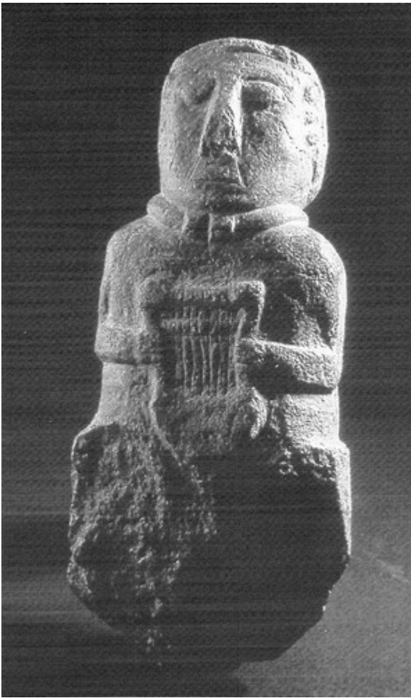
Paule. Statue de personnage masculin à la lyre.

associé : ils sont attribués à une fourchette chronologique relativement large, qui s'étend de la fin du III ème siècle, jusqu'au milieu du I er siècle av. J.-C. Compte tenu de ces comparaisons, on pourrait proposer un intervalle de datation relative de la statue de Beaupréau relativement étendu, qui couvrirait la seconde moitié du III ème siècle et la première moitié du II ème siècle av. J.-C.