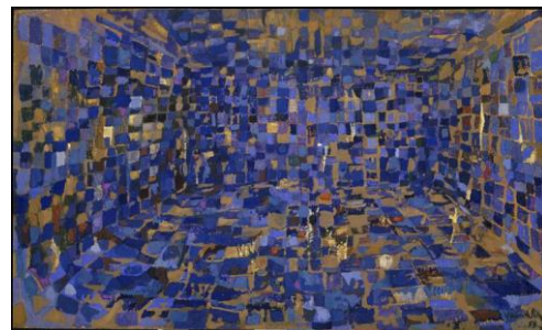
La chambre bleue 1951, maria helena Veira da Silva

http://www.topito.com/top-oeuvres-salvador-dali https://artzerotrois.wordpress.com/2015/04/02/destination-collaboration-de-salvador-dali-walt-disney/