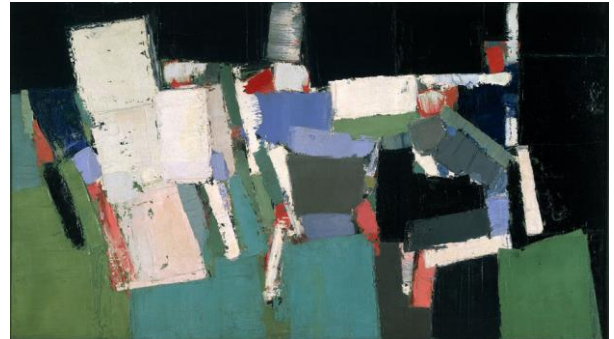
Parc des princes 1952, nicolas De Stael

http://www.guggenheim.org/new-york/collections/collection-online/artwork/2594 http://www.fine-arts-museum.be/fr/la-collection/rene-magritte-lempire-des-lumieres http://wheb.ac-reims.fr/ia08artsvisuels/images/stories/img/apiedoeuvres/Pistes%20p%C3%A9dagogiques/Pistes_ped_Magritte.pdf