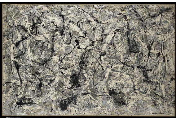
Peinture N°28, 1950 Jackson Pollock

http://www.pierre-soulages.com/ http://musee-soulages.grand-rodez.com/ https://www.youtube.com/watch?v=TfinJkIltI http://www.centrepompidou.fr/cpv/ressource.action?param.id=FR_R-3147ecdb29aa79a3a32d068a7d060&param.idSource=FR_E-3147ecdb29aa79a3a32d068a7d060