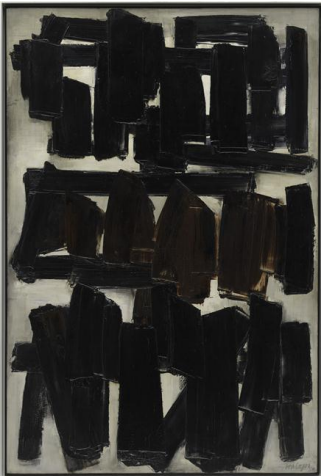
Peinture, 1956 Pierre Soulages

http://www.vasarely.com/ http://www.fondationvasarely.fr/ http://www.vasarely.net/ http://patrimoine-artistique.upmc.fr/biographie/bio-vasarely.html