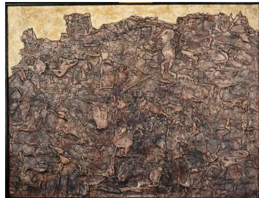
le voyageur sans boussole 1952 Jean Dubuffet

http://www.lesartsdecoratifs.fr/francais/arts-decoratifs/collections-26/parcours-27/thematique/galerie-jean-dubuffet/ http://www.dubuffetfondation.com/bio_set.htm http://www.centrepompidou.fr/cpv/ressource.action?param.id=FR_R-34d8232a9d2cdd97fbe7c4ad694034a8&param.idSource=FR_R_P-34d8232a9d2cdd97fbe7c4ad694034a8 http://www.artezia.net/art-graphisme/art/art-brut/art-brut.htm