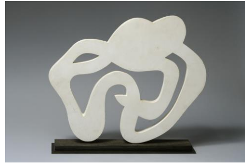
Araignée 1960, Jean Arp

https://www.youtube.com/watch?v=JXOw0uTY1kQ http://www.jackson-pollock.info/techniques-artiste.html http://www.laboratoiredeguste.com/spip.php?article35 http://www.jackson-pollock.com/jackson-pollock-drip.html