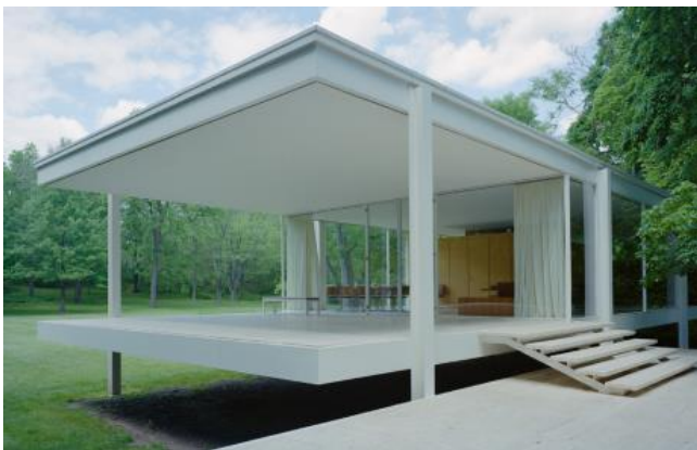
Farnsworth house 1951, Mies van der rohe http://www.farnsworthhouse.org/ http://farnsworth.house.pagesperso-orange.fr/historique_txt.htm http://www.preservationnation.org/magazine/2004/july-august/ja04feature2.html http://www.miessociety.org/legacy/projects/ http://miesbcn.com/ http://fr.wikiarquitectura.com/index.php/Fichier:Casa_Farnsworth_29.jpg http://www.designboom.com/portrait/mies/bg.html http://www.artdecodesignshop.net/Chaise-Longue-MR40-Mies-Rohe-1932-meubles-103.artdeco