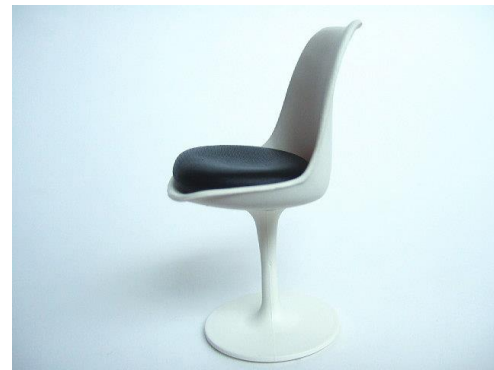
Chaise tulipe, 1956, eero Saarinen http://www.photo.rmn.fr/C.aspx?VP3=SearchResult&VBID=2CO5PCOUYA3TL&SMLS=1&RW=1600&RH=789