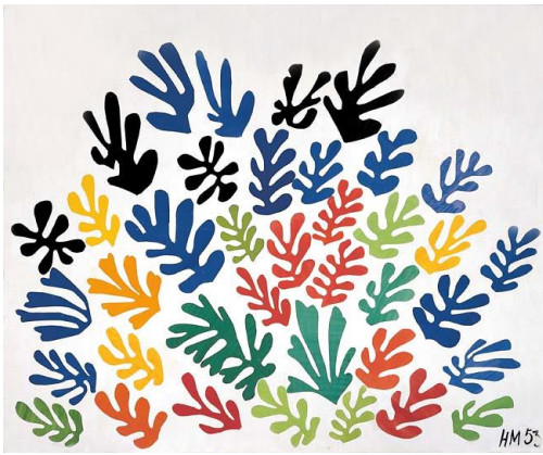
La gerbe 1953, henri Matisse

http://www.henri-matisse.net/paintings/ex.html http://mediation.centrepompidou.fr/education/ressources/ENS-matisse/ENS-matisse.htm http://www.eternels-eclairs.fr/tableaux-matisse.php