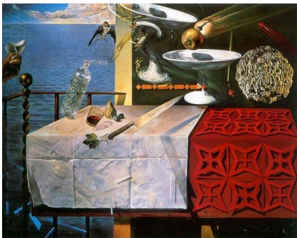
Nature morte vivante 1956, salvador Dali

http://www.lesartsdecoratifs.fr/francais/arts-decoratifs/collections-26/parcours-27/thematique/galerie-jean-dubuffet/ http://www.dubuffetfondation.com/bio_set.htm http://www.centrepompidou.fr/cpv/ressource.action?param.id=FR_R-34d8232a9d2cdd97fbe7c4ad694034a8&param.idSource=FR_R_P-34d8232a9d2cdd97fbe7c4ad694034a8 http://www.artezia.net/art-graphisme/art/art-brut/art-brut.htm