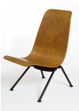
fauteuil antony 1956, jean prouvé http://www.lesartsdecoratifs.fr/francais/musees/musee-des-arts-decoratifs/parcours/moderne-contemporain/1950-1960/jean-prouve/chauffeuse-antony