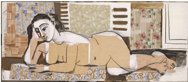
Femme nue allongée 1955, pablo Picasso