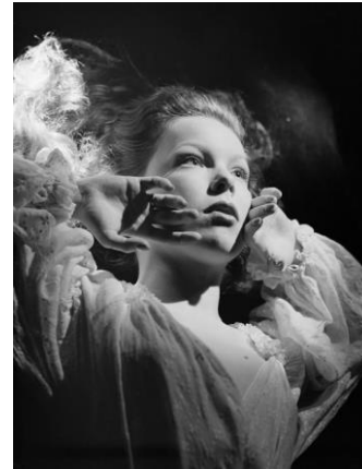
Cécile Aubry, 1950 par sam Lévin http://www.photo.rmn.fr/Package/2C6NU017I635 http://starsicones.canalblog.com/albums/photographe_sam_levin/index.html http://www.photogriffon.com/les-maitres-de-la-photographie/Sam-LEVIN/Maitre-de-la-photo-Sam-Levin.html http://www.mediatheque-patrimoine.culture.gouv.fr/fr/biographies/levin_sam.html