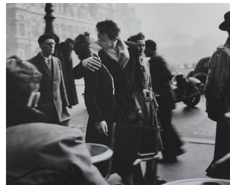
Le baiser de l'hôtel de ville 1950, Robert Doisneau http://www1.rfi.fr/actufr/articles/064/article_35775.asp http://www.photographie.com/archive/publication/104024 http://www.copypasteculture.com/2013/01/robert-doisneau/ denise colomb : http://www.mediatheque-patrimoine.culture.gouv.fr/fr/archives_photo/visites_guides/colomb.html