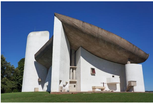
Chapelle Romchamp 1955, Le corbusier http://www.chapellederonchamp.fr http://www.collinenotredameduhaut.com/ http://www.sites-le-corbusier.org/fr/chapelle-notre-dame-du-haut http://www.marseille-citeradiieuse.org/