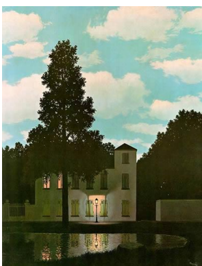
l'empire des lumières 1954,

http://jeanne-bucher.com/galerie/index.php?option=com_content&task=view&id=20&Itemid=37