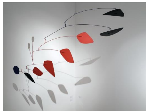
Mobile 1959, Calder

http://ww2.ac-poitiers.fr/histoire-arts/spip.php?article93&debut_page=2 http://pedagogie.ac-toulouse.fr/col-ingres-montauban/spip/IMG/pdf/cours_brevet_L_homme_qui_marche.pdf http://www.fondation-giacometti.fr/fr/art/16/decouvrir-l-c5%93uvre/18/alberto-giacometti-database/110/oeuvres-choisies/#?ref=collection&open=selected&work=832