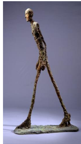
L'homme qui marche 1960,

http://www.natalieseroussi.com/artistes/oeuvres/2/jean-arp http://artbasel-2014.insidetradeshows.com/en/artworks/jean-arp-amphore-de-muse