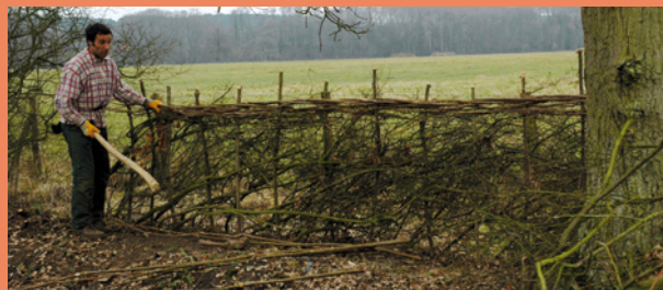
Haie plessée à 1.10 m