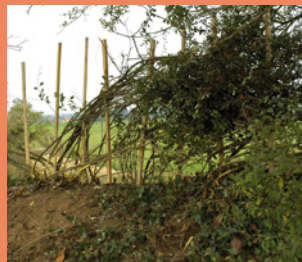
Entrelaçage des brins