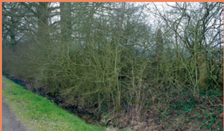
Etat initial de la haie bocagère *