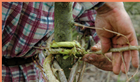
Réalisation de la clé *