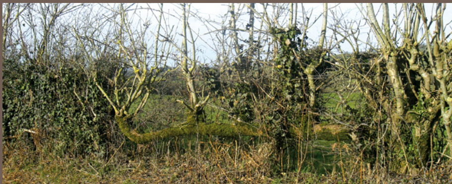
Vestige d'une haie plessée.

Le plessage offre une multitude de fonctions. Il permet de restructurer une haie dégradée, de délimiter ou de clore un espace à partir d'une haie jeune (plantation de 4 ou 5 ans), de constituer un garde-corps. C'est aussi une excellente réponse esthétique qui permet d'ouvrir des perspectives en abaissant le niveau de la haie et de structurer un jardin.