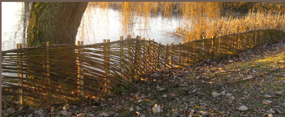
Haie bouturée plessée en sécurisation de plan d'eau.