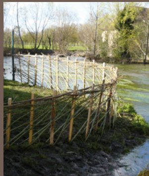
Maintien de berge Asnières-sur-Vègre (72)