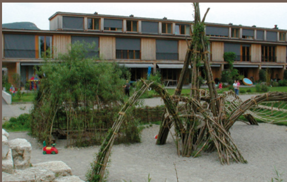
Jeux pour enfants en saules bouturés Arlesheim, Suisse

Contacts : Maison Botanique 41270 Boursay - tél. : 02 54 80 92 01 Association Passages : Franck Viel - Le Champ Feuillet 72400 Avezé - tél. : 02 43 71 87 49 Bibliographie : "Le plessage de la haie champêtre : clôture vivante" ouvrage publié par la Maison Botanique et l'Association Passages Fiche réalisée par le CAUE de la Sarthe - tél. : 02 43 72 35 31 1, rue de la Mariette 72000 Le Mans - www.caue-sarthe.com