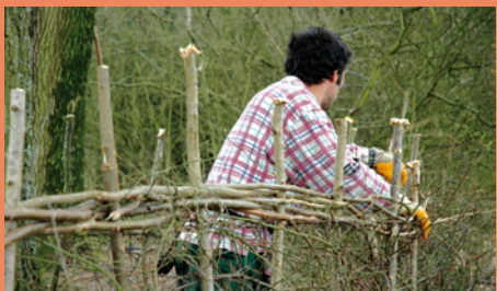
Tresse * finale et ajustement des piquets