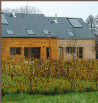
Système séparatif : haie de saules bouturés plessés - Langouët (35)