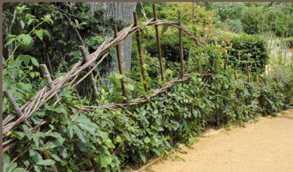
"De branche en branche" de Franck Viel, Andréa Németh et Olivier Raquois - Festival de Chaumont-sur-Loire 2005

Le plessage s'adapte à la conception contemporaine des jardins (clôture, limites séparatives, création de perspectives).