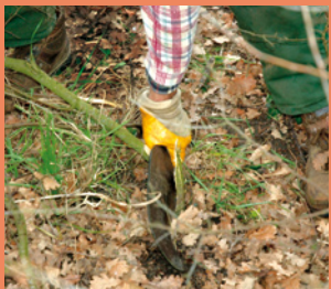
Demi-recépage à l'aide d'une serpe *