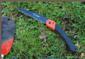
Scie à denture japonaise