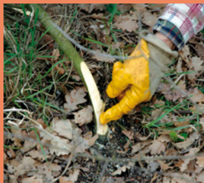
Suppression du talon * avec une scie à denture japonaise *