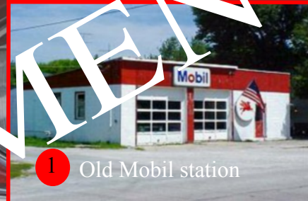
1 Old Mobil station

Sortir de la ville par S West St, poursuivre sur la US-66 W Compter OH 30 mn pour arriver sur Pontiac