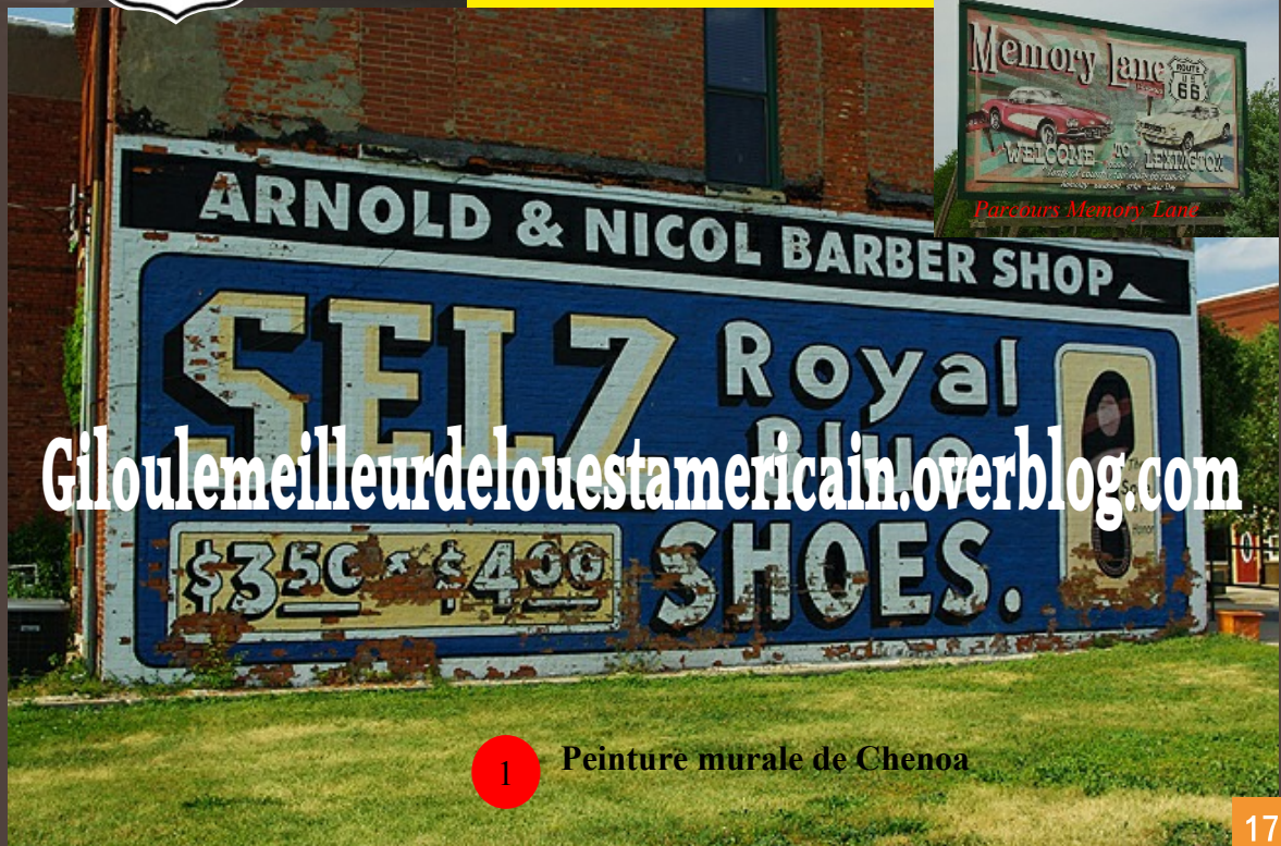
1 Peinture murale de Chenoa

Sortir de Chenoa en suivant l'Historic Route 66, passer les bourgades de Lexington et Towanda, puis vous arriver sur Normal et Bloomington. A savoir Lexington à conservé un tracé d'environ 1 miles surnommé "memory lane" de la R66, sur lequel il est possible d'effectuer une ballade ponctuée de panneaux traçant l'histoire de la route mère.