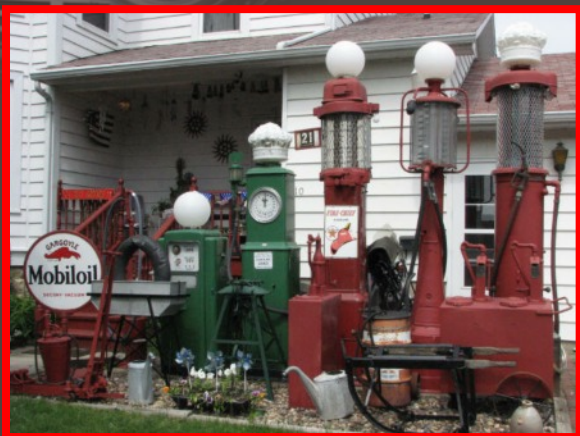
2 Vintage Gas Pumps , la collection d'anciennes pompes à essence devant une superbe propriété.