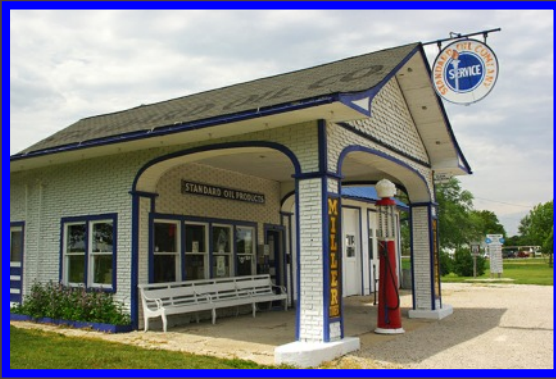
3 La superbe Standard Oil Station À l'angle de W Deer St

Sortir de la ville par S West St, poursuivre sur la US-66 W Compter OH 30 mn pour arriver sur Pontiac