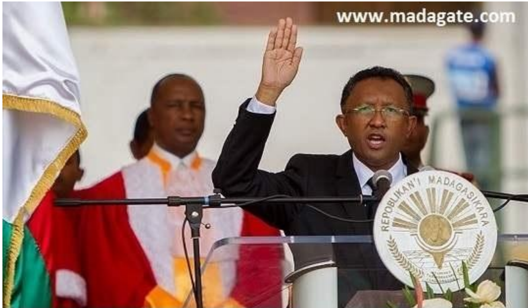
Mahamasina, 25 Janoary 2014. Teto no nanomboka ny tantara ratsiny...