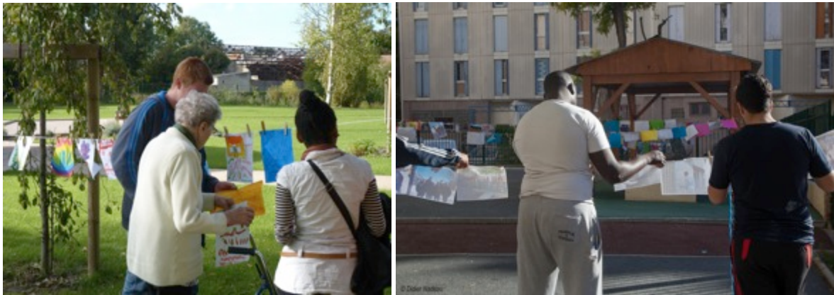
La Grande Lessive® à la Maison de retraite de Bourbourg (59) et dans une cité à Marseille (13)

communes de Rives-de-Saône, la ville d'Aigues-Mortes, la ville de Villefranche-de-Lauragais et bien d'autres collectivités territoriales mettront en place des étendages dans les rues. Au Havre, le centre communal d'action sociale organisera un étendage. À Toulon, tous les centres sociaux et trois centres de loisirs initieront un étendage et des ateliers en centre ville. À Pau, ce seront tous les centres de loisirs de la ville qui agiront de même. À Troyes, à l'initiative de l'AGEEM, une Grande Lessive en centre-ville rassemblera plus de 1000 élèves d'école maternelle. À Montpellier, Villandraut, Sète, Nice, Saint-Etienne de Tinée, Valergues... et dans plus de cent cinquante villes, ce seront tantôt des associations, des maisons pour tous, des centres sociaux, des M.J.C. ou des relais Petite enfance qui agiront avec les habitants.