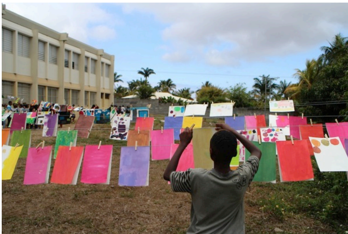
La Grande Lessive ® à La Réunion en octobre 2013