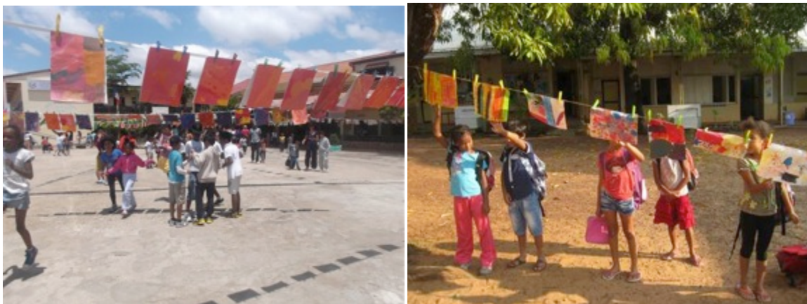
La Grande Lessive ® à Antananarivo et Mahajanga à Madagascar, en octobre 2013

Les étendages hors de France sont en général réalisés à l'initiative d'associations culturelles (Tunisie, Grande-Bretagne...), d'institutions dédiées à la petite enfance (Casablanca...), d'établissements enseignant le français et d'Alliances Françaises .