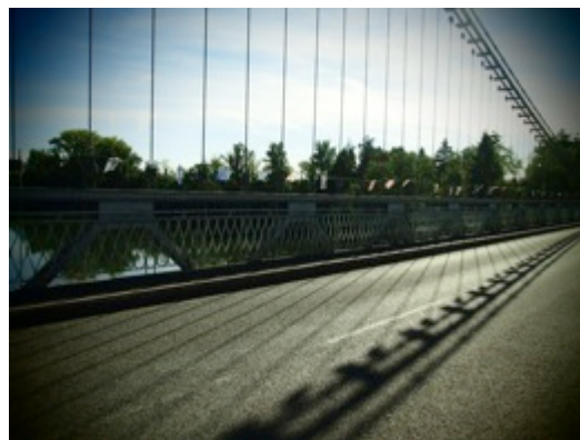
À Villemur-sur-Tarn, l'étendage se déploie sur le pont grâce à la M.J.C.