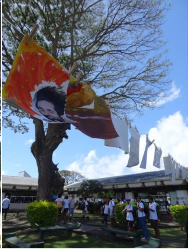
La Grande Lessive® dans les cités Nord à Marseille, dans un collège à Tahiti, à Tampere en Finlande et à Athènes en Grèce, en octobre 2013