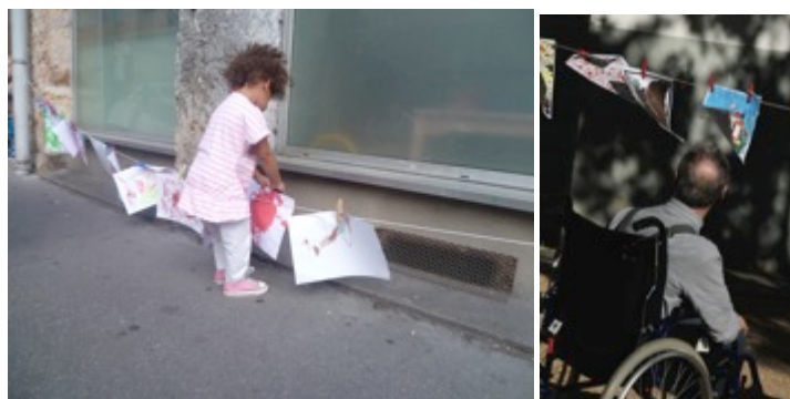
Première exposition ?

De nombreux établissements accueillant de très jeunes enfants, des personnes handicapées jeunes ou moins jeunes (Centre de réadaptation de Mulhouse, 400 personnes), des lieux de soins, des foyers pour personnes âgées s'intègrent ainsi à cette action faite par tous : la crèche familiale de La Trinité, le foyer de vie de Cuxac Cabardes, l'IEEM de l'ADAPT à Cambrai, La Résidence Louis Farastier à Monchanin, l'EHPAD Florentine Carnoy à Warloy-Baillon, le Relais des lutins de l'Ouest et la Maison de l'enfance de Marcy-l'étoile... Les liens continuent à se tisser dans les villes : à Reyrieux, trois écoles, la M.J.C. et le centre social agiront ensemble. Nous sommes particulièrement heureux de cette diversité qui incarne l'esprit même de cette action ayant pour objectif de promouvoir la pratique artistique pour tous.