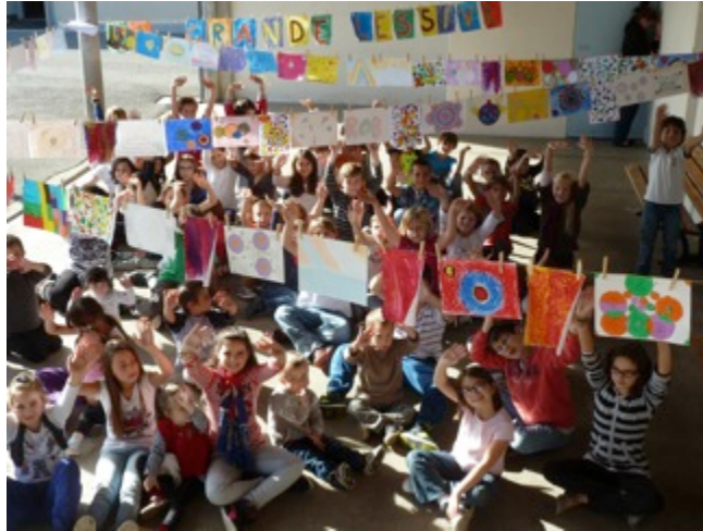
La Grande Lessive® dans une école de Montpouillan (47)

Ancrés dans les quartiers, les établissements scolaires s'inscrivent désormais à La Grande Lessive® par centaines et il est impossible de les citer tous. Cependant, nous ne résistons pas au plaisir d'en donner un aperçu. Il y aura les écoles de Meillant, Baugy, Ussel, Venaray-les-Laumes, Rocquebrune-Cap-Martin, Fontiès d'Aude, Seurre, Douville, Beaumont-les-Autels, Sauve, Montpezat, Bérat, Le Versoud, Poisat, Niedermorschwihr... et de nombreuses écoles dans la circonscription de Saint-Dizier et de Sézanne, douze écoles du réseau de la Large à Saint-Ulrich, ainsi que celles d'un réseau « ambition réussite » à Lyon, le lycée agricole de Vesoul, l'école bilingue de Haute-Savoie à Annecy, les collèges Gauguin, Madame de Staël, Jean-Baptiste Clément à Paris, le collège Notre-Dame à Bressuire, Ronsard à Montmorency, l'école élémentaire et le collège Camille Claudel à Montigny-les-Cormeilles, le lycée polyvalent Jean-Moulin à Béziers, le lycée La Providence à Saint-Malo... Pour la première fois, l'I.N.S.A. de Rouen (école d'ingénieurs de 1 600 personnes) participera à cette action.