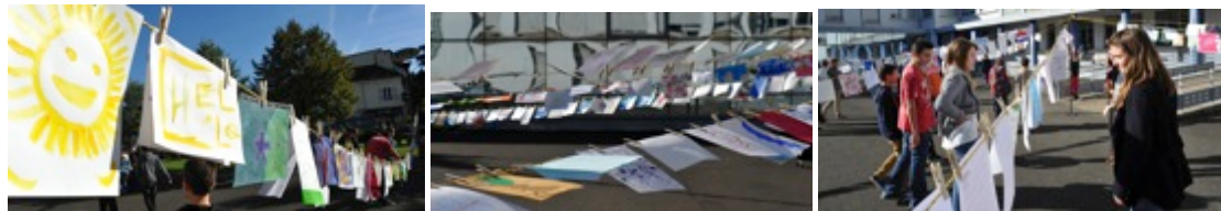
La Grande Lessive® au Collège Cabanis à Brive-la-Gaillarde (19)

Ancrés dans les quartiers, les établissements scolaires s'inscrivent désormais à La Grande Lessive® par centaines et il est impossible de les citer tous. Cependant, nous ne résistons pas au plaisir d'en donner un aperçu. Il y aura les écoles de Meillant, Baugy, Ussel, Venaray-les-Laumes, Rocquebrune-Cap-Martin, Fontiès d'Aude, Seurre, Douville, Beaumont-les-Autels, Sauve, Montpezat, Bérat, Le Versoud, Poisat, Niedermorschwihr... et de nombreuses écoles dans la circonscription de Saint-Dizier et de Sézanne, douze écoles du réseau de la Large à Saint-Ulrich, ainsi que celles d'un réseau « ambition réussite » à Lyon, le lycée agricole de Vesoul, l'école bilingue de Haute-Savoie à Annecy, les collèges Gauguin, Madame de Staël, Jean-Baptiste Clément à Paris, le collège Notre-Dame à Bressuire, Ronsard à Montmorency, l'école élémentaire et le collège Camille Claudel à Montigny-les-Cormeilles, le lycée polyvalent Jean-Moulin à Béziers, le lycée La Providence à Saint-Malo... Pour la première fois, l'I.N.S.A. de Rouen (école d'ingénieurs de 1 600 personnes) participera à cette action.