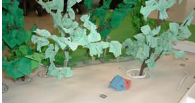
Maquette de la cour