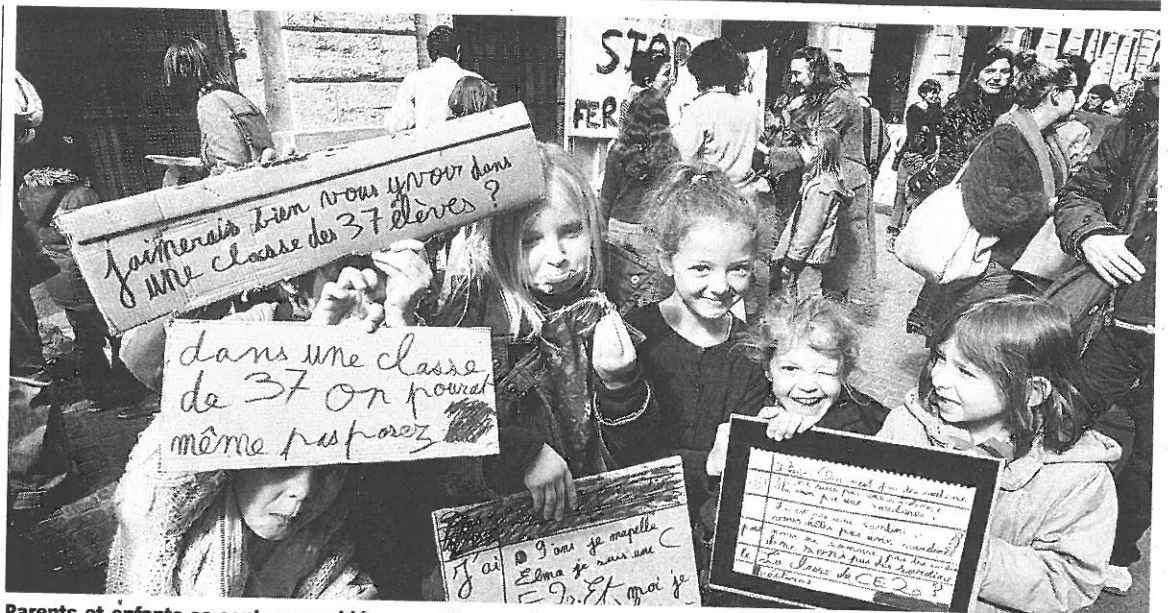
Parents et enfants se sont rassemblés pour dénoncer la fermeture d'une classe à A. Comte et d'une à L. Malet. D.M.

Éducation. Les parents d'élèves de Gambetta-Clemenceau et Celleneuve ont manifesté hier devant le rectorat.