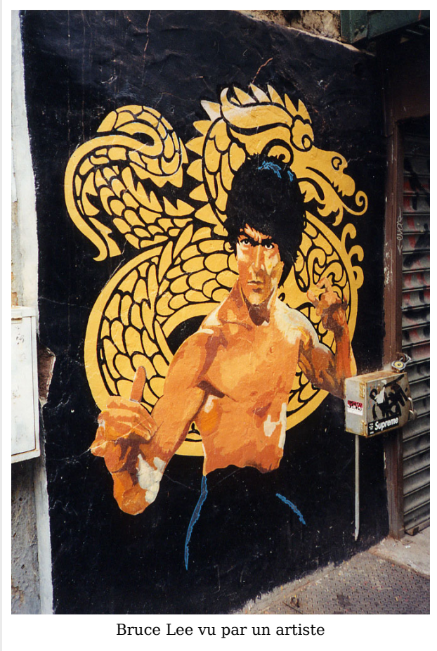
Bruce Lee vu par un artiste

Lee se rend compte des limites de son art martial et commence à remettre en cause l'efficacité des arts martiaux traditionnels. Ce qui aboutira à la création du Jeet Kune Do («