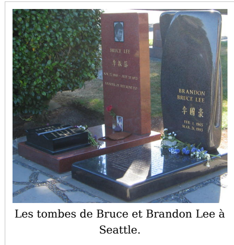
Les tombes de Bruce et Brandon Lee à Seattle.

Bruce Lee meurt le 20 juillet 1973 à Hong Kong et est enterré au cimetière de Lake View à Seattle. Bien que des rumeurs circulent sur les raisons de son décès, la cause officielle est une réaction allergique à un analgésique, un cas rare d'hypersensibilité à l'équagésic [2] , [3] . Mais comme tous les acteurs chinois de classe mondiale Bruce Lee était poursuivi par la mafia chinoise et refusait de payer pour qu'on le laisse tranquille, ce qui laissa supposer un possible meurtre, d'autant plus que certains journalistes accusaient l'ancien producteur de Bruce Lee, Raymond Chow, d'avoir tout organisé avec les mafieux car Bruce Lee avait décidé de produire ses films lui-même coupant toute relation avec son réalisateur qui perdait sa poule aux œufs d'or [réf. nécessaire] . Pourtant ce qui a surtout choqué l'opinion mondiale c'est que durant son autopsie les médecins ont découvert que Bruce Lee comme la plupart des stars hollywoodiennes des années 70 fumait du hachich.