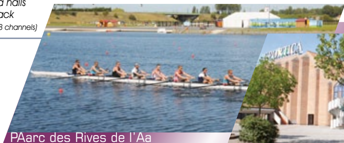
PAarc des Rives de l'Aa