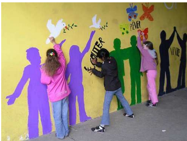
Ecole Michelet de Juvisy