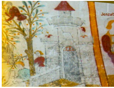
Eglise de Jenzat (03)