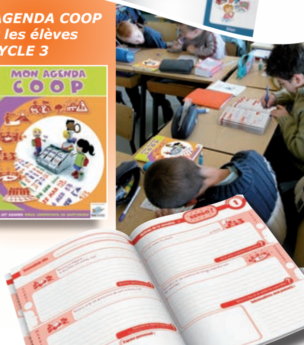
Illustrations, conception et réalisation graphique : Robert Touati